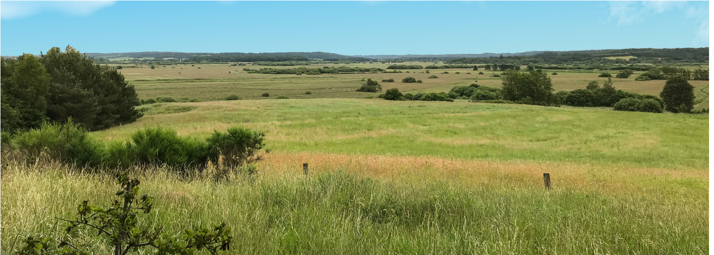
Udsigt over den skønne Nørreådal på en overskyet sommerdag.