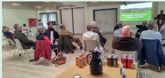
Foto fra en koncentreret workshop. Håndsprit, coronapas og afstand var en forudsætning for kunne mødes og diskutere den lokale landskabsstrategi.