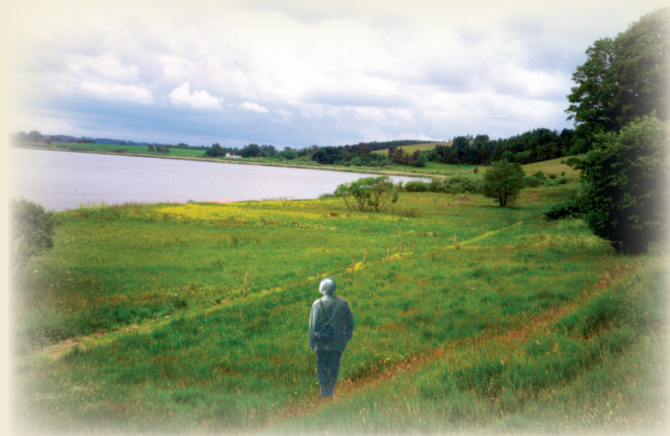
Udsigt over Hærup Sø

■ ■ Hærup Sø ligger som en perle i en lille sidedal til Skals Ådal. Fra parkeringspladsen fører en afmærket sti forbi en fyrreplantage til Skamris Dal. Her er en smuk udsigt over den lavvandede sø, omgivet af enge og bakker med skov, krat, overdrev og hede.