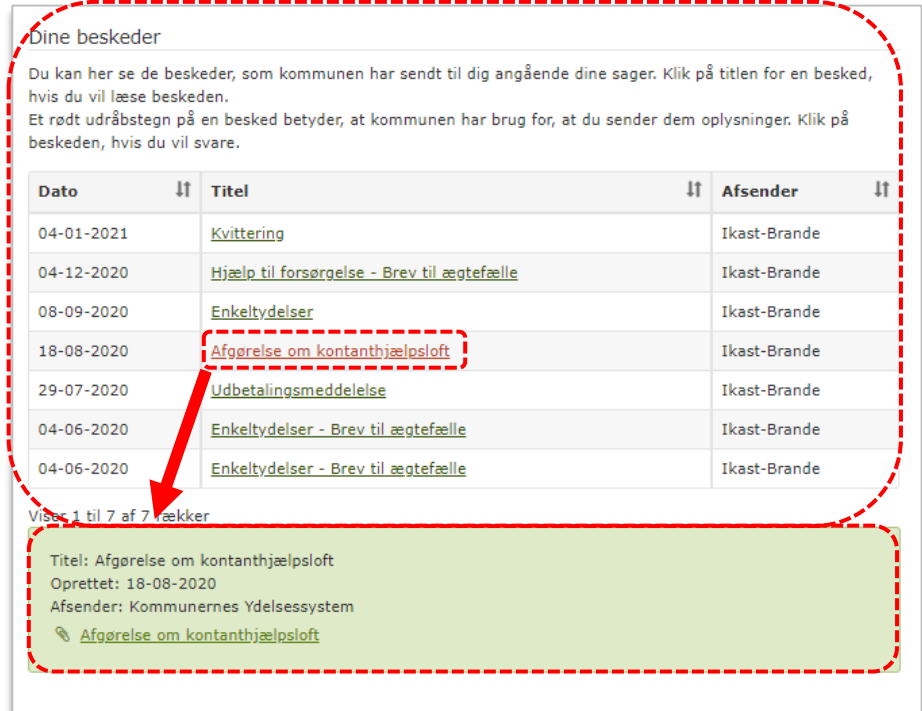
Billede 4: Dine beskeder