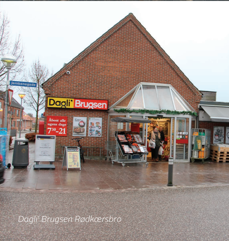
Dagli' Brugsen Rødkær